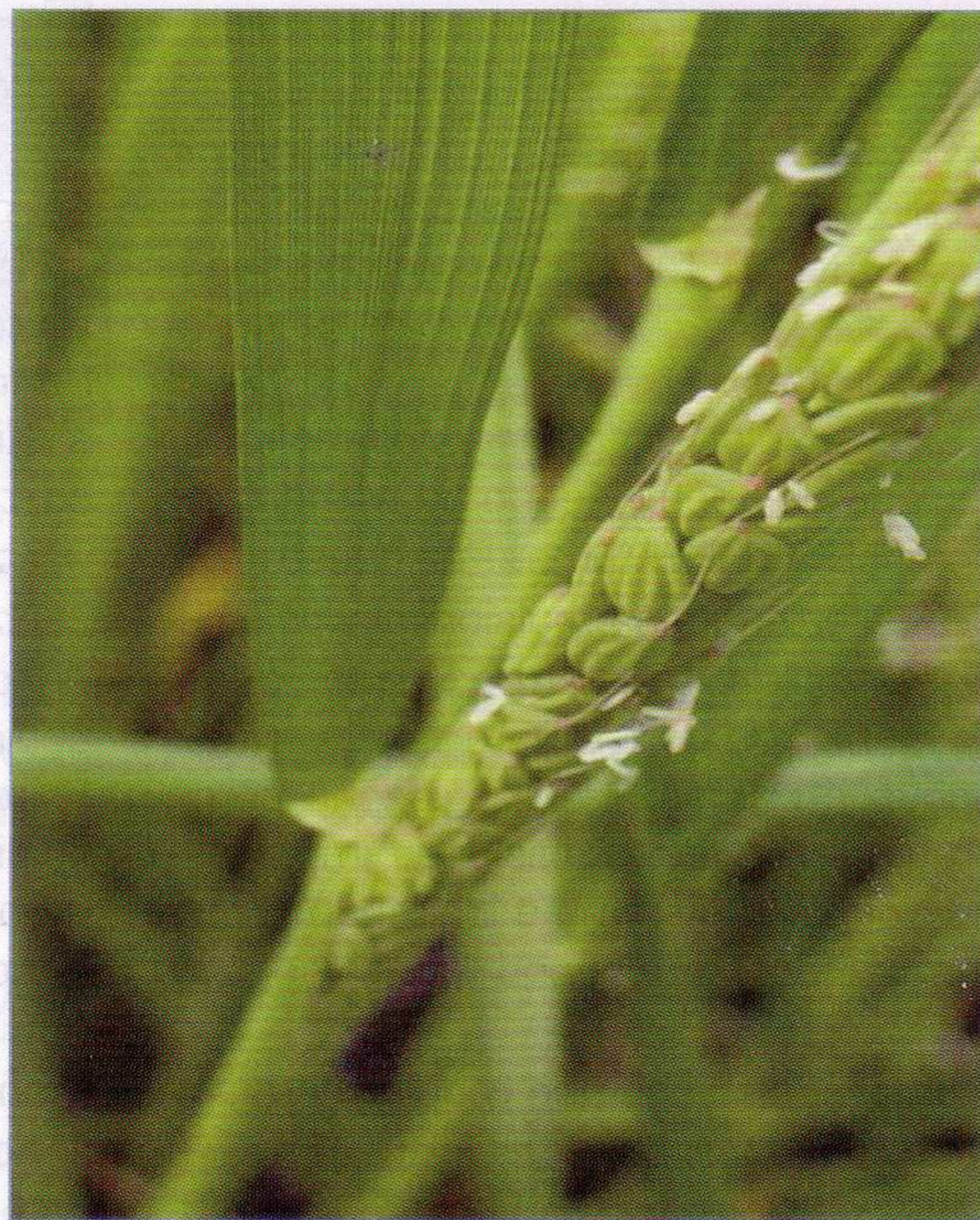
Figura 1 Una piantina di riso

Si tratta di un prodotto, INCI= Polyglyceryl-3 Rice Branate , che può essere definito come un sistema emulsionante